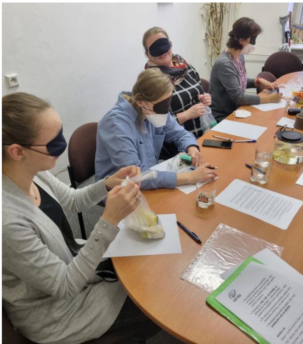
Školíme kolegyně z Denního stacionáře Domovinka - "Zažij si den poslepu"