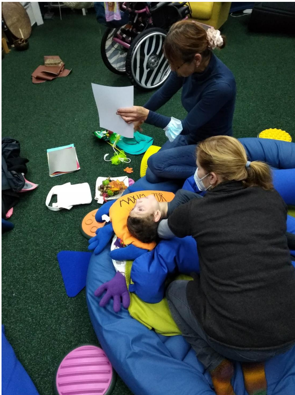
KAFIRA DĚTEM - péče o dětské klienty