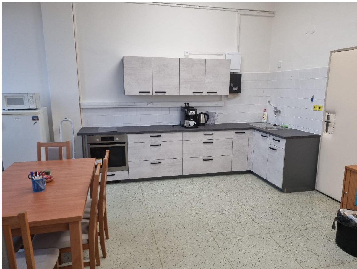
Nová cvičná kuchyňka ve středisku Nový Jičín pořízená z dotačního programu Moravskoslezského kraje

Velmi nás také těší, že se nám dařilo naše aktivity, kvalitu a rozsah poskytovaných služeb také v roce 2021 významnou měrou zajišťovat a rozvíjet díky podpoře nadačních fondů a nadací :