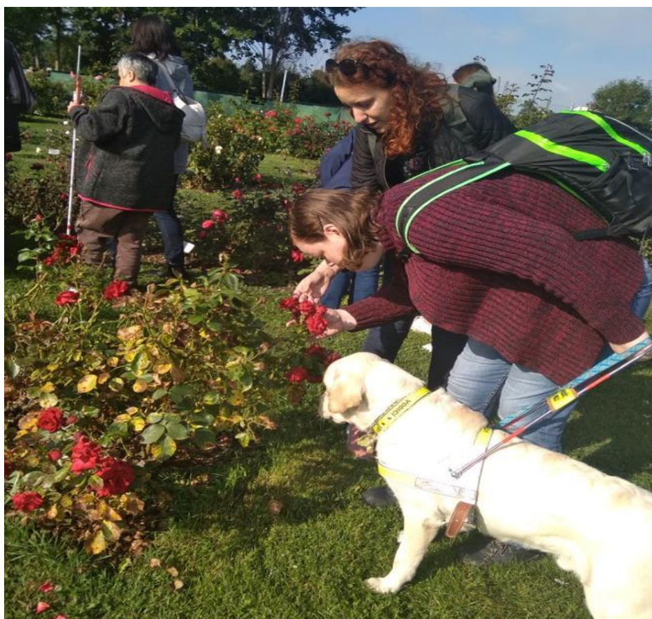
Aktivizace v Zahradě smyslů v Olomouci