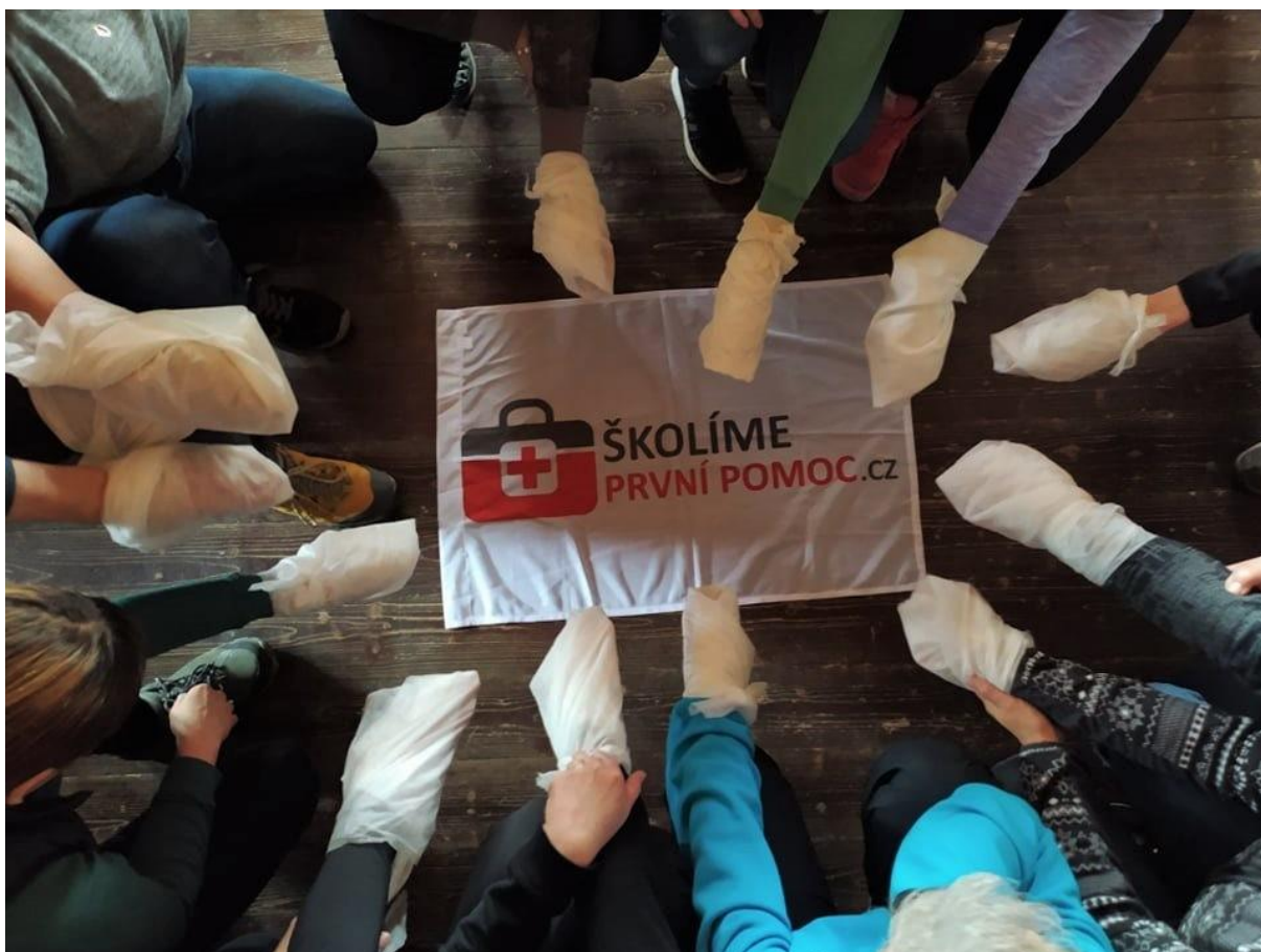
Teambuilding a společné školení první pomoci

Také v r. 2021 pokračovala naše spolupráce se specialistkou z oblasti zrakové terapie, prostorové orientace, samostatného pohybu a speciální pedagogiky, jež se nám dlouhodobě velmi osvědčuje zvláště u dětských uživatelů a uživatelů v kombinaci zrakového postižení a mentálního postižení. V rámci spolupráce s Univerzitou Palackého v Olomouci jsme byli zapojeni do projektu zaměřeného na rozvoj představitosti osob se zrakovým postižením prostřednictvím 3D modelů jako aplikační garanti projektu. Na základě trvajících zájmu ze strany zájemců i uživatelů pokračovaly nácviky samostatné chůze s bílou holí, prostorové orientace a samostatného pohybu. Rozvíjela se naše spolupráce se Společností pro ranou péči, navázali jsme také uzší spolupráci se speciálními pedagogickými centry a pokračovala spolupráce s dalšími sociálními službami, například pro Denní stacionář Domovinka jsme zajistili úspěšný seminář "Zažij si den poslepu".